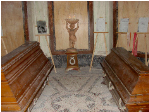
Mausoleum Noer 27.11.2006

Der Türsturz und die Türpfeiler, welche die Supraporte tragen, sind mit gleichmäßigen Blattornamenten gestaltet.