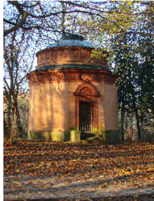
Mausoleum Noer 28.11.2006

In diesen Bau sind viele Kleinigkeiten eingeflossen, die eine Beziehung zum Leben und zur Arbeit des Grafen haben (Indienreisen und -forschung). Ob diese Elemente vom Grafen selbst zu seinen Lebzeiten oder von seiner Frau bzw. vom Architekten eingearbeitet wurden, lässt sich nicht feststellen. Als ungefähre Zeitspanne der Fertigstellung vermute ich die Jahre zwischen 1882 und 1885.